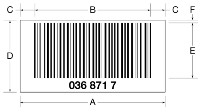
Rysunek 2 Wymiary kodów kreskowych