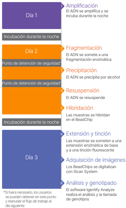
Figura 3: Flujo de trabajo de Infinium LCG. El ensayo de Infinium usa un flujo de trabajo rápido de tres días que requiere un tiempo de participación activa mínimo.