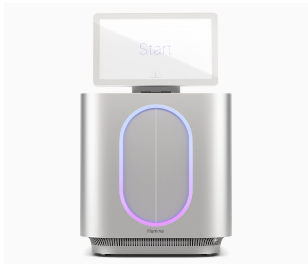
Figure 1 : Systèmes de séquençage MiSeq i100 et MiSeq i100 Plus : l'innovation d'Illumina continue d'élargir l'accès au séquençage de nouvelle génération (SNG) avec des systèmes de paillasse conçus pour être simples et rapides.

Chez Illumina, l'expérience client est au centre de toute innovation, ce qui facilite la préparation des bibliothèques, le séquençage et l'analyse des données. Chaque aspect du flux de travail de la série MiSeq i100 est optimisé pour réduire la durée et les ressources nécessaires à la réalisation de projets (figure 2). Les systèmes MiSeq i100 et MiSeq i100 Plus offrent un flux de travail simplifié avec une configuration de l'analyse en seulement trois étapes et en moins de 20 minutes.