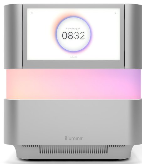
Figura 1: NextSeq 2000 Sequencing System: il NextSeq 2000 System offre design innovativo, chimica avanzata, bioinformatica semplificata e un flusso di lavoro intuitivo per la più ampia gamma di applicazioni e flessibilità di scala su un sistema di sequenziamento da banco.

Il NextSeq 1000 Sequencing System e il NextSeq 2000 Sequencing System sfruttano le ultime innovazioni nell'ottica, nel design dello strumento e nella chimica dei reagenti per ridurre al minimo il volume della reazione di sequenziamento aumentando al contempo l'output e riducendo i costi per corsa. Gli utenti possono ora ottenere processività, qualità e costi richiesti per andare incontro alle proprie esigenze, a partire da dimensioni di batch più piccole e processività inferiore fino a processività superiore