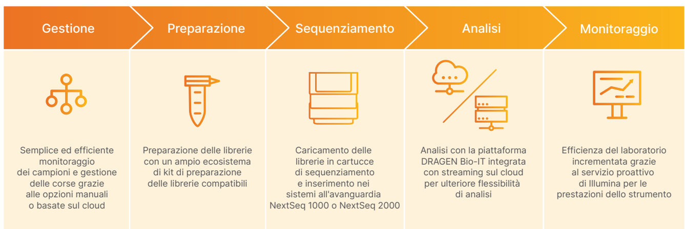
Figura 2: Flusso di lavoro intuitivo dalla libreria all'analisi: il NextSeq 1000 Sequencing System e il NextSeq 2000 Sequencing System forniscono un flusso di lavoro completo che include semplice impostazione della corsa, un ampio ecosistema di kit di preparazione delle librerie compatibili, funzionamento "carica e vai" e analisi secondaria integrata sullo strumento.

Poiché i reagenti non lasciano mai la cartuccia, lo strumento con procedimento "secco" non richiede lavaggi e consente una manutenzione semplificata ottimizzando l'efficienza.